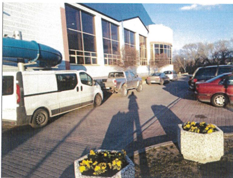
Zdjęcie 2. Nieprawidłowo parkujące pojazdy w okolicach basenu.

Powyższe zdjęcia zostały udostępnione z przeróżnych okresów oraz pór roku, tak aby uświadomić Pani Radnej, iż nie jest to jednorazowy problem a problem stały w tamtym rejonie miasta. Kilkukrotnie kierowcy autobusów zgłaszali sprawę na policję, iż nie mogą wykonać bezpiecznego manewru z powodu zastawionych wyjazdów co kończyło się tym, iż policja bezradnie rozkładała ręce, ponieważ jest to teren wewnętrzny, nad którym pieczę stanowi Centrum Sportu i Rekreacji i wyłącznie tylko ten organ może w tym miejscu interweniować.