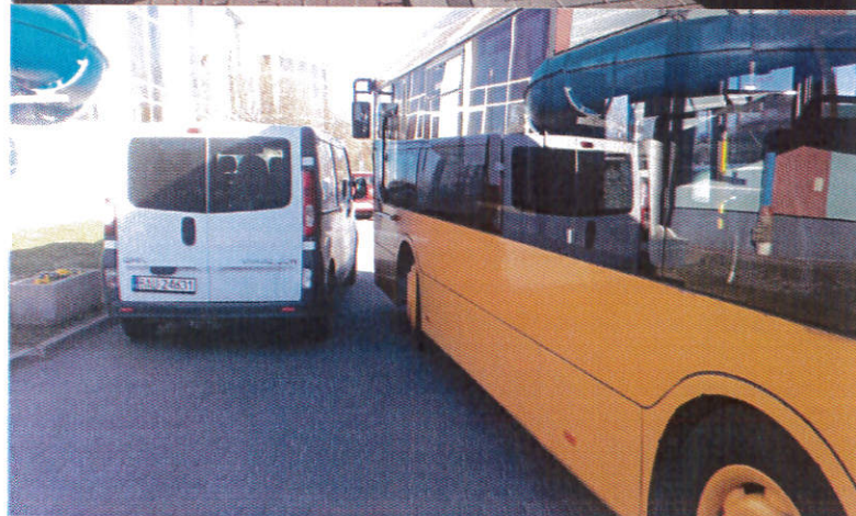
Zdjęcie 1. Zastawiony wjazd uniemożliwił ruch autobusu linii nr 1 w kierunku Dworzec PKP.