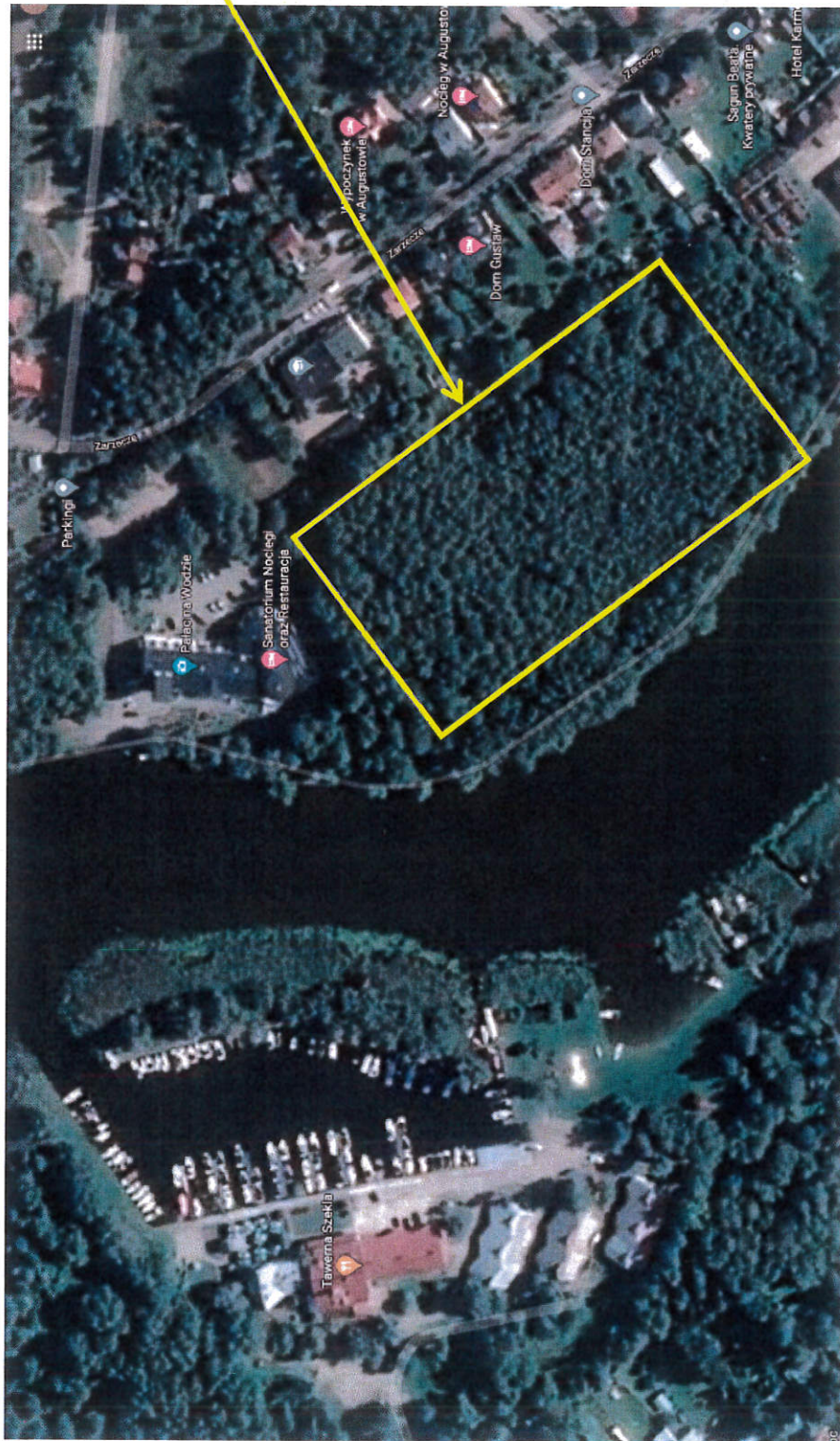
Zat. 1. Widok z góry_ działka nr ew. 1/16 obręb 0004 w Augustowie