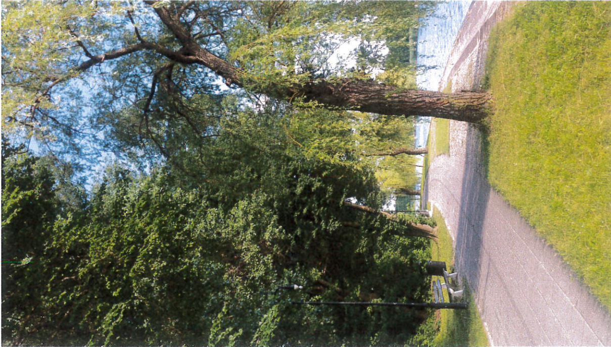
Załącznik 3. Bulwary nad Nettą w sąsiedztwie działki nr. 1/16 – aktualne zdjęcia