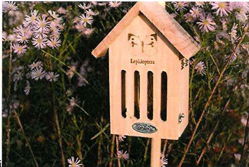
Domki dla motyli Huśtawka miejska