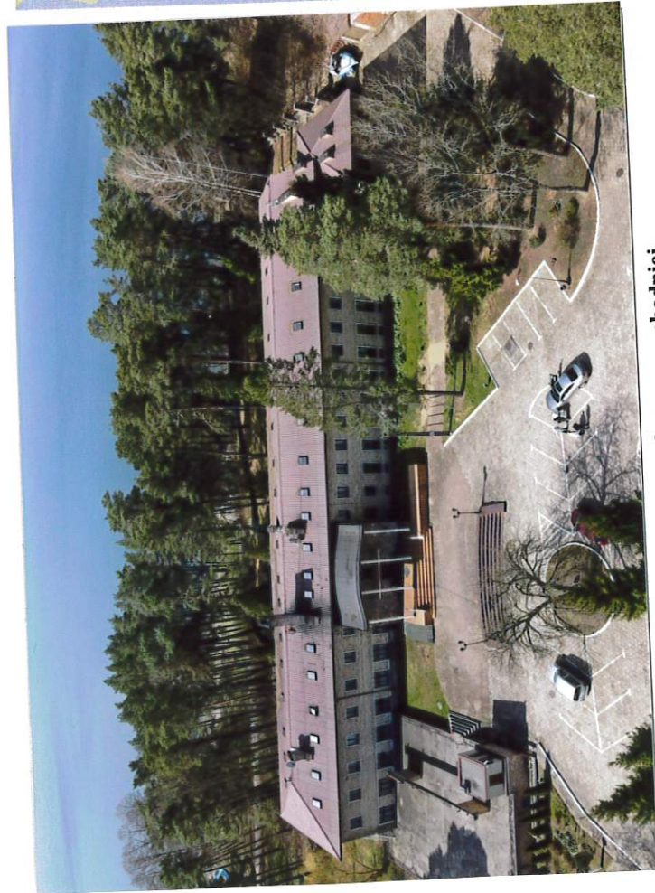
Widok z góry od strony wschodniej